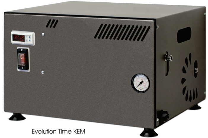
Evolution Time KEM

Questa serie di pompe professionali rappresenta la soluzione ideale, con un elevato standard di qualità e sicurezza, per tutte le esigenze di realizzazione di impianti di nebulizzazione professionali per l'abbattimento di odori, polveri e la diffusione di prodotti chimici per la disinfezione. Il gruppo pompante è realizzato con materiali resistenti alla corrosione come Nickel, Ottone, Acciaio Inox, Alluminio, Viton, garantendo un funzionamento privo di problemi anche nelle condizioni più avverse. Il temporizzatore digitale integrato permette di dosare l'intensità dell'effetto nebulizzante, quindi di gestire al meglio il rendimento dell'impianto con notevoli benefici sui consumi e risparmi fino al 70%. Notevole anche la silenziosità sui modelli dotati di motore elettrico a basso consumo QES, tecnologia studiata per le applicazioni in ambienti che necessitano di basse emissioni acustiche. Il drenaggio a recupero interno BPS evita gli sprechi d'acqua, di prodotto chimico e consente un migliore raffreddamento del gruppo pompante. Portate da 1 a 6 l/min, con motore elettrico monofase.